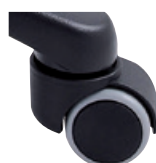
Kolečka pro tvrdé povrchy v (KT)