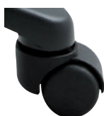
Kolečka pro měkké povrchy (KB)